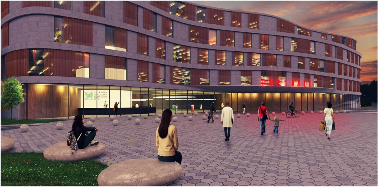
Rendering del nuovo ingresso e del nuovo blocco polifunzionale SUD.